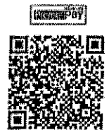
ร่วมทำบุญเข้าบัญชี “เงินฝากสำนักงาน ป.ป.ช. (กฐินพระราชทาน)”