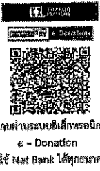
สแกนผ่านระบบอิเล็กทรอนิกส์ e - Donation โดยใช้ Net Bank ได้ทุกธนาคาร

๑. ร่วมทำบุญผ่านระบบอิเล็กทรอนิกส์ (e - Donation) โดยการสแกน QR Code ด้านล่างนี้ ผ่านแอปพลิเคชัน Net Bank ได้ทุกธนาคาร ซึ่งท่านจะได้รับการลดหย่อนภาษีจากสรรพากร โดยอัตโนมัติ และไม่ต้องใช้ใบอนุโมทนาบัตร ในการลดหย่อน