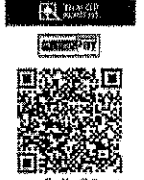
สแกนเข้าบัญชีเงินฝาก สำนักงาน ป.ป.ช. (กฐินพระราชทาน) โดยใช้ Net Bank ได้ทุกธนาคาร

๒. ร่วมทำบุญโดยการสแกน QR Code ด้านล่างนี้ เข้าบัญชี ธนาคารกรุงไทย จำกัด (มหาชน) สาขากระทรวงพาณิชย์ ชื่อบัญชี "เงินฝากสำนักงาน ป.ป.ช. (กฐินพระราชทาน)" ท่านสามารถแจ้งความประสงค์ขอรับใบอนุโมทนาบัตร จากสำนักงาน ป.ป.ช. ได้ดังนี้