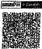
ร่วมทำบุญผ่านระบบ E - Donation

๑. ร่วมทำบุญ โดยใช้ Application ของธนาคารใดก็ได้ สแกนผ่านรหัส QR Code นี้ ซึ่งยอดเงินร่วมทำบุญจะถูกบันทึกในระบบ E - Donation ของกรมสรรพากรโดยอัตโนมัติ ในรายการลดหย่อนภาษี (กรณีไม่จำเป็นต้องออกใบอนุโมทนาบัตร)