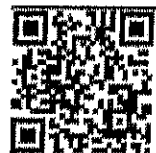
เรื่อง เครื่องเงิน