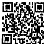
เรื่อง มังคุดเขาคีรีวง GI