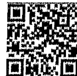
เรื่อง เครื่องเงิน