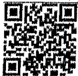
เรื่อง ส้มโอทับทิมสยามปากพนัง GI