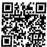
เรื่อง กระจุต