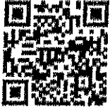
เรื่อง กระเป๋าขานลิเกา วีดีโอ