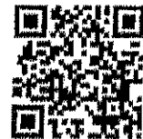
เรื่อง มังคุดสีม่วง GI