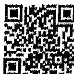
เรื่อง ส้มโอทับทิมสยามปากพนัง GI