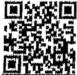
เรื่อง กระเป๋าขานลิเกา รูปภาพ