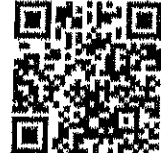
เรื่อง กระจุต รูปภาพ